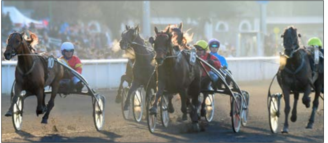
FÖRSVARAR TITELN? Finishen i Prix de Belgique, med Bird Parker etta, Bold Eagle tvåa och Readly Express trea. Tarzan har feeling för att tvåan blir etta när det gäller som mest.

✓ TIDSRANKEN: 14.5: 5 Stronghold. 14.7: 1 Gravity Falls. 15.0: 8 Un Dernier Rire, 12 Dani Boko.