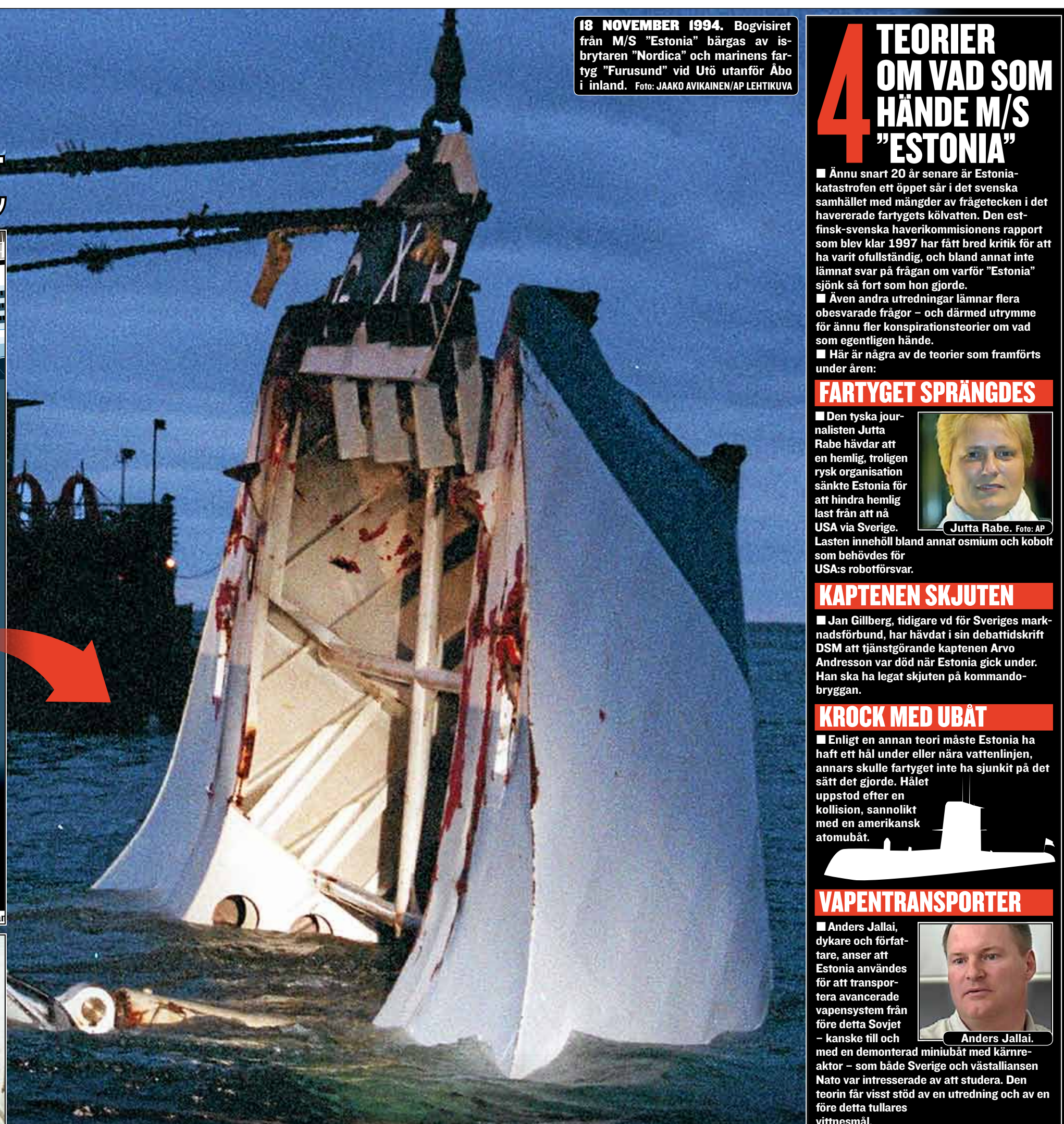
18 NOVEMBER 1994. Bogvisiret från M/S "Estonia" bärgas av isbrytaren "Nordica" och marinens fartyg "Furusund" vid Utö utanför Åbo i inland.