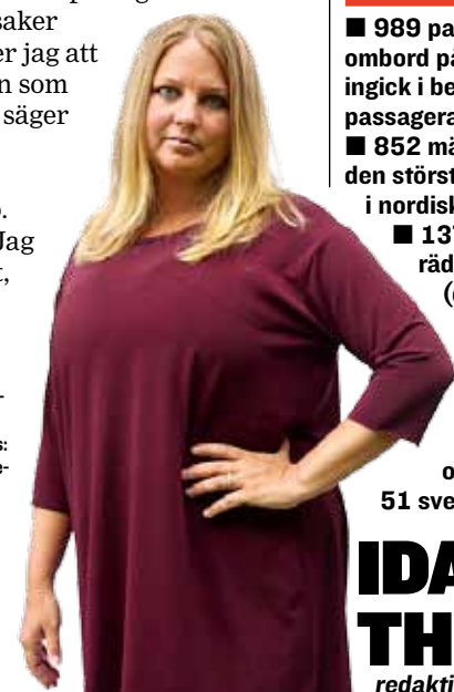
KÄLLOR: Förutom de intervjuades egna berättelser har följande källor använts: Expressens arkiv, TT, Haverikommissionens slutrapport om M/S "Estonias" förslin, "En granskning av Estoniakatastrofen och dess följder" (SOU 1998:132), "Estoniasamlingen.se" (sammansatt av Id Styrelsen för psykologiskt försvar,

så mycket fortfarande, 20 år senare. Han som dessutom överlevde.