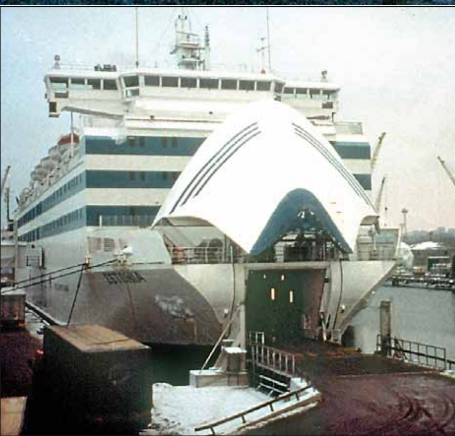
M/S "ESTONIA". Tidigare bild på passagerarfärjan i hamn i Stockholm med bogvisiret öppet.