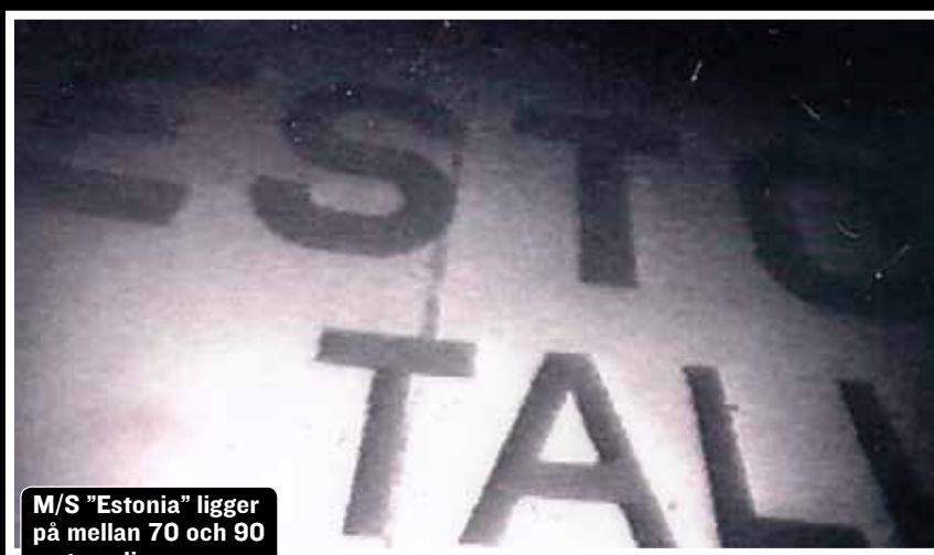
M/S "Estonia" ligger på mellan 70 och 90 meters djup.