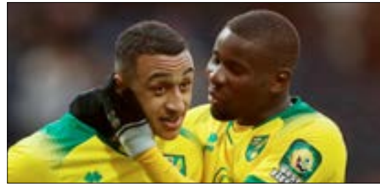
EN JÄTTESKRÄLL. Norwich kan fälla storlaget Manchester United på bortaplan.