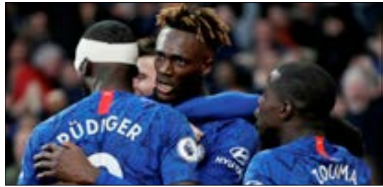
STARK ETTA. Chelsea har toppchans mot ett formsvagt Burnley.