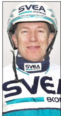
Örjan Kihlström En av världens skickligaste kuskar

✓ V75-1: ► 5 Milliondollarrhyme visade ju mycket bra form direkt i comebacken senast och tävlar han på samma nivå på lördag så måste det vara en bra chans. 3 Transcendence och 9 Son of God slåss om andraplatsen. ✓ Min vinnare: ► 5 Milliondollarrhyme