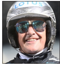
Robert Bergh En av Sveriges största tränare

Systemet, V75-1: 3, 1 (9, 8). V75-2: 4, 5, 13, 12 (10, 3). V75-3: 5, 2, 9 (4, 3). V75-4: 2 Rus Can (9, 15). V75-5: 5 Magic Cash (9, 15). V75-6: 2, 8, 11, 10, 7, 4 (5, 1). V75-7: 1, 3 (10, 9). 288 rader/144 kr