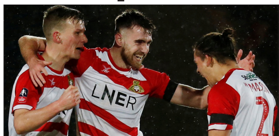
MOTIVATIONSVINNARE. Doncaster jagar kvalplats till The Championship.