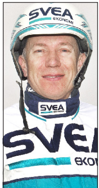
Örjan Kihlström En av världens skickligaste kuskar