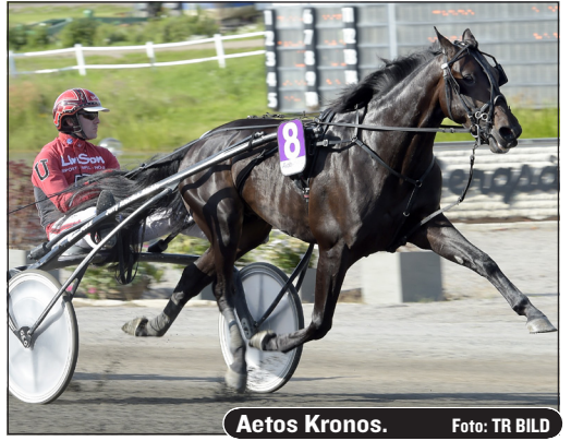
Aetos Kronos.