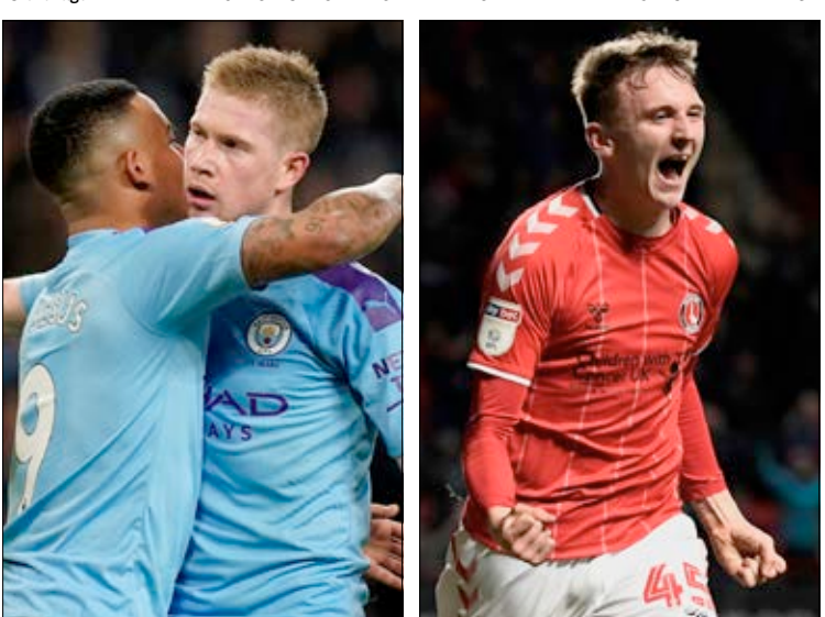
TVÅ SPIKAR. Manchester City och Bristol City är två spikförslag på söndagens Europatips.