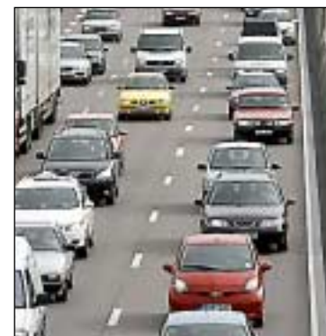
Högst avgift när trängseln är som störst.

11 mars klubbas det av Göteborgs kommunfullmäktige.